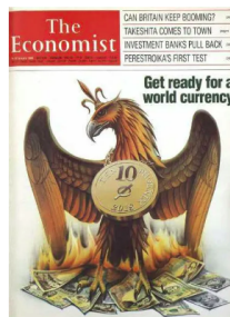
Une de the economist de 1982

Si vous contrôlez le portefeuille des gens, vous les contrôlez quasi entièrement.