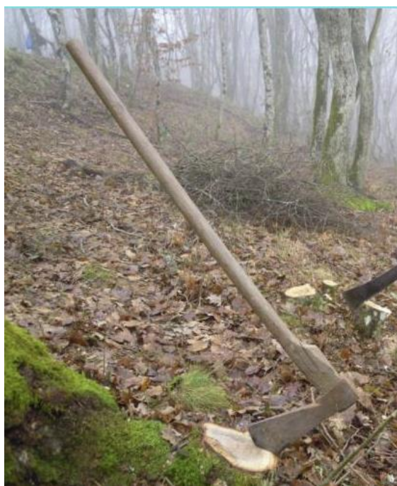
La cognée est une hache qui se caractérise par un long manche et une partie tranchante assez fine pour bien pénétrer dans le bois et qui ne sert uniquement qu'à l'abatage.

Mais voici ce que j'ai eu l'impression qu'Il me disait. Il a dit : J'aurais pu répondre rapidement alors, si je ne traitais que le fruit, mais je vais plus loin. Je suis en train d'agir sur les racines dans les nations, dans les gouvernements où les gens selon 2 Chroniques 7 :14 s'humilient, prient pour chercher Mon visage, en se détournant de leurs mauvaises voies. Ma parole est toujours vraie. J'entendrai du ciel je pardonnerai leur péché et guérirai leur terre. Mais Il a dit, la seule façon dont je peux le faire est de m'occuper des racines et pas seulement les fruits. Et donc pendant une période où on peut se demander ce qui se passe ? Dieu veut que nous sachions, je crois, qu'Il utilise Sa cognée (Mt 3 : 10)